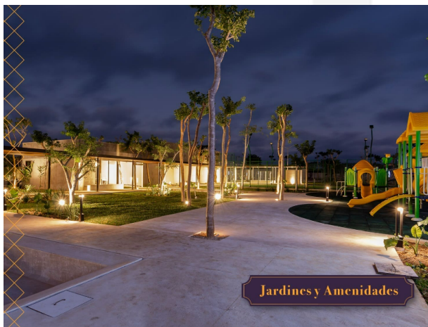
Jardines y Amenidades