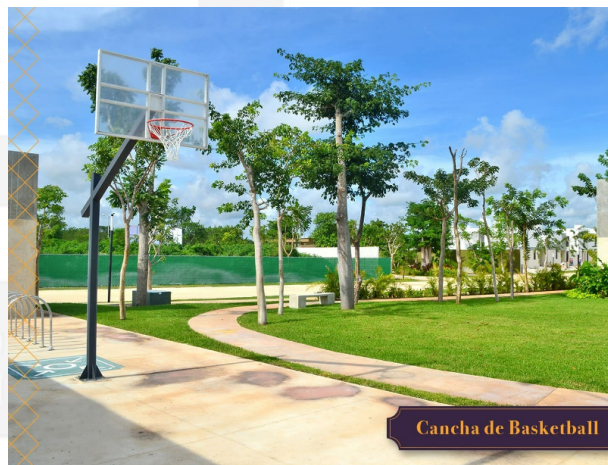
Cancha de Basketball