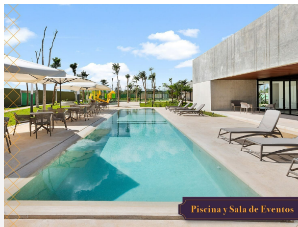
Piscina y Sala de Eventos