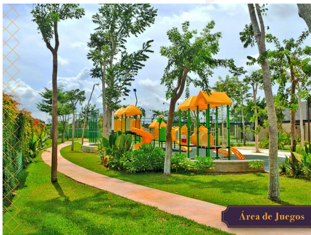
Área de Juegos