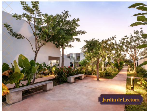
Jardín de Lectura