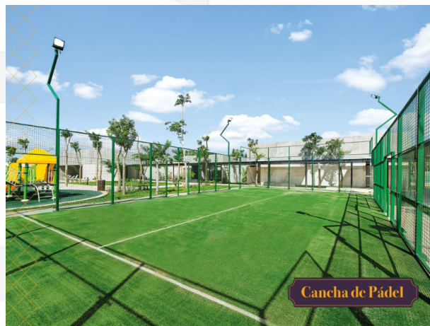
Cancha de Pádel